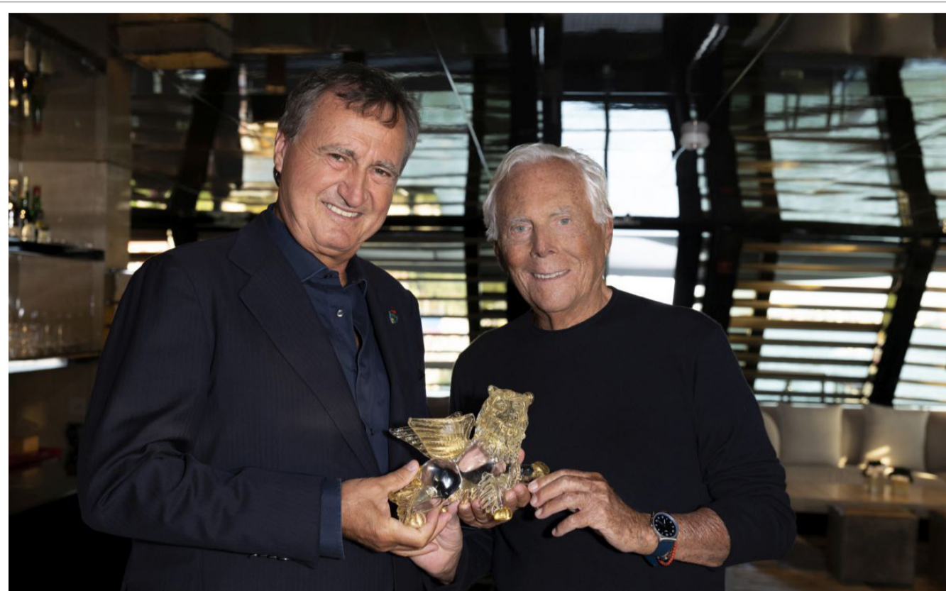
[ The mayor of Venice awards the “Golden Lion” to Giorgio Armani (ph. Press Office of the Municipality of Venice) ]