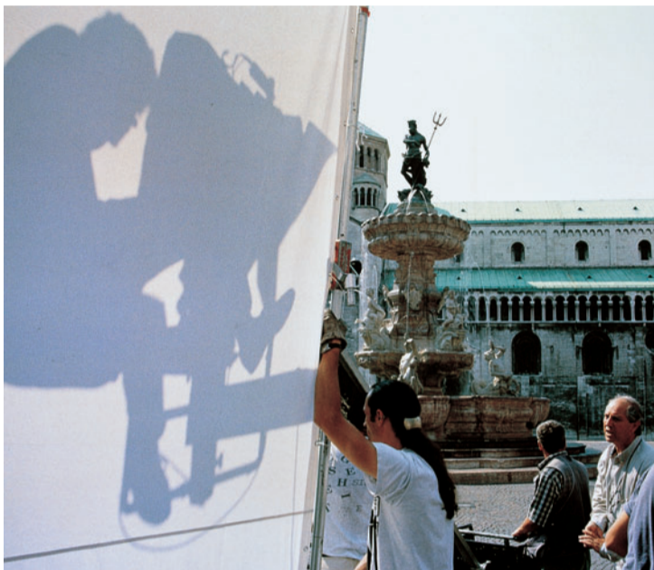
映画『ミルカ』のセットで撮影の指揮をするヴィットリオ・ストラオーロ