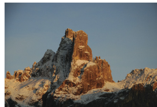
Cimon della Pala (標高 3185 m)。