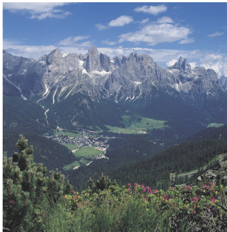
ドロミティ山塊にあるサン・マルティノ・ディ・カストロツツアの村。 後ろに控えるのは険しいPale di San Martinoの山々 。 関連記事はp.4に。

当日チヴィタヴェツキア港を出発したコンコルディア号 は、アルジェンタリオ半島とジーリオ島 (国立トスカーナ 群島自然保護区にある) の中間を通過して次の寄港地サ ヴォーナに向かうことになっていたが、フランチェスコ・ スケッツィーノ船長は、「ジーリオ島に住む先輩に挨拶する」