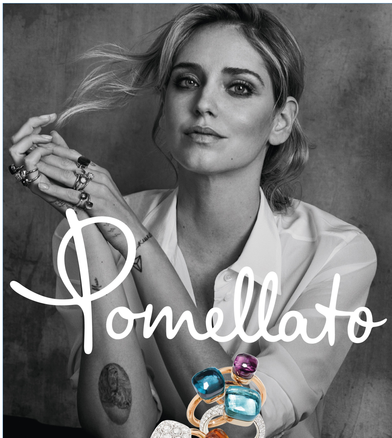
CHIARA FERRAGNI Fashion Entrepreneur