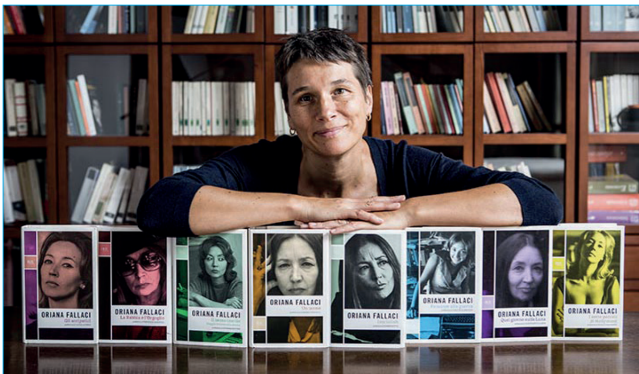
© Concept & design: GianAngelo Pistoia