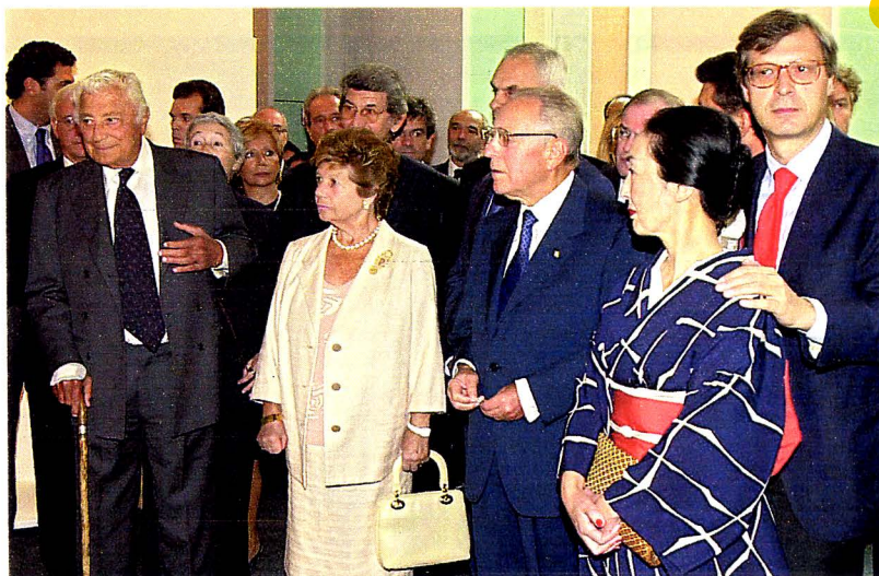
Qui a fianco, da sinistra: Gianni Agnelli, Franca e Carlo Azeglio Ciampi, dietro di lui Marcello Pera, Vittorio Sgarbi e la vedova di Balthus, Setsuko. Sotto: Carolina ed Ernst von Hannover. In basso: Giuseppe Pontiggia e Domenico Starnone, finalisti del Campiello