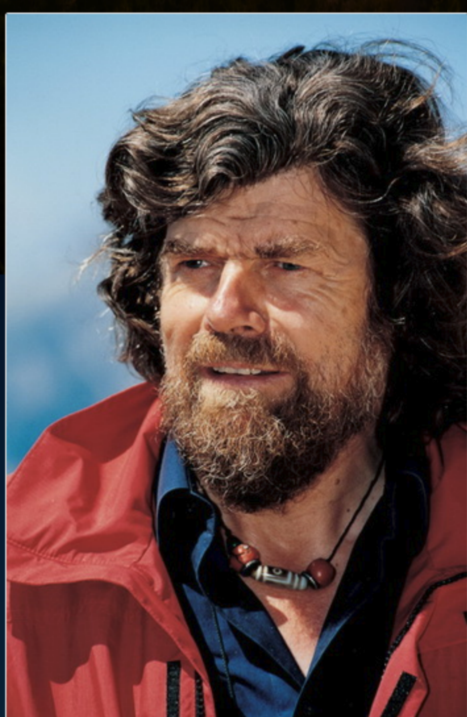
Reinhold Messner