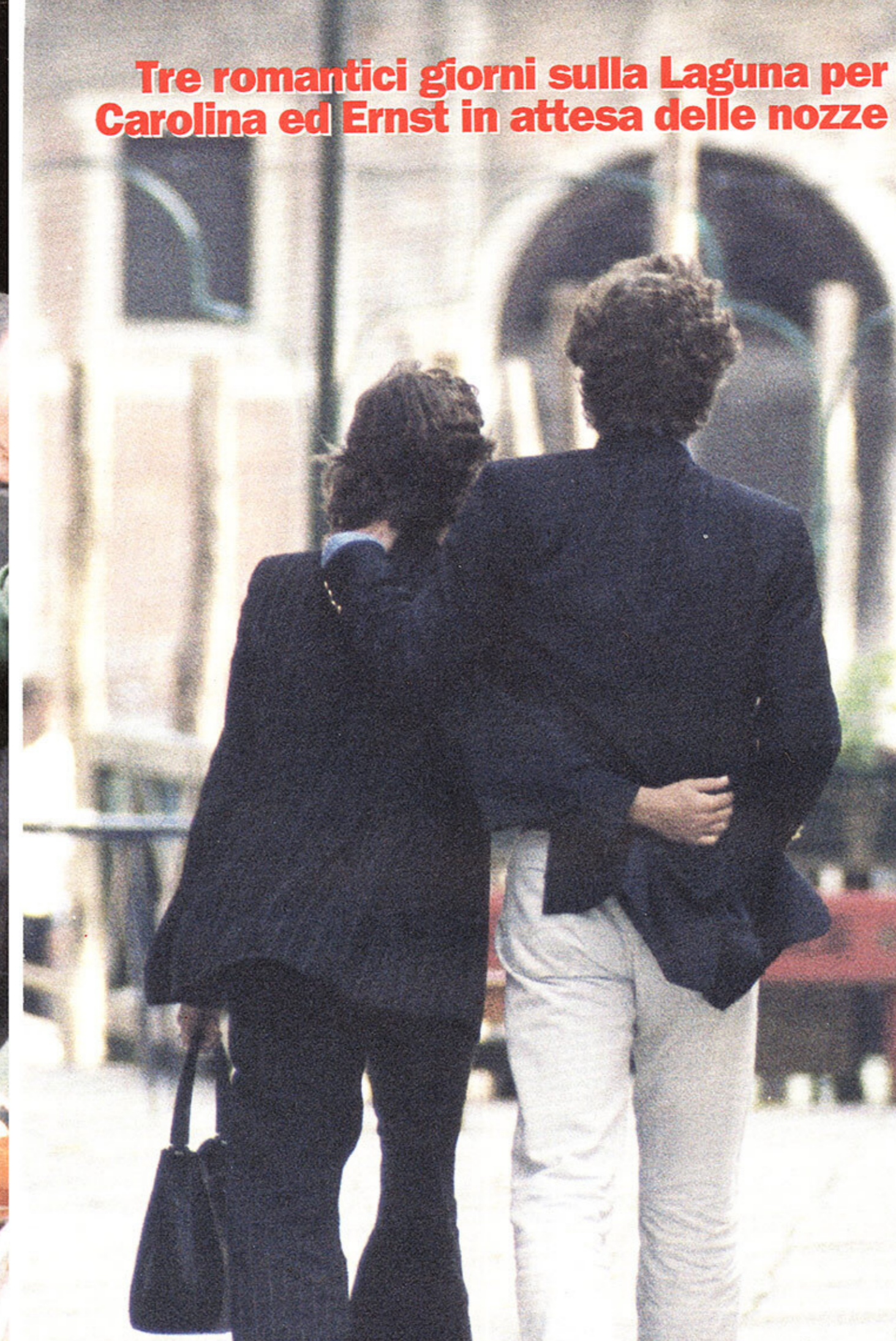
Venezia. Carolina di Monaco, 41 anni, ed Ernst di Hannover, 44, a passeggio abbracciati: così non li abbiamo mai visti. A sin., in alto, Ernst al terrazzo dell'Hotel Gritti. Sotto, Gianni Agnelli, 77 anni, e, a ds., il nipote John Jacob Elkann, 21, detto Iaki. =>