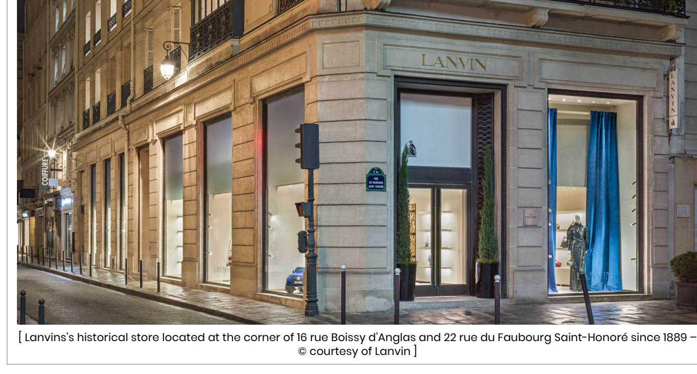
[ Lanvin's historical store located at the corner of 16 rue Boissy d'Anglas and 22 rue du Faubourg Saint-Honoré since 1889 - ]