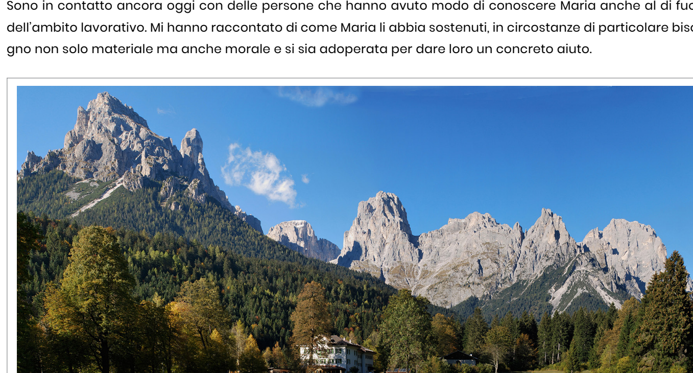
[ Panoramic view of val Canali in Primiero - ]