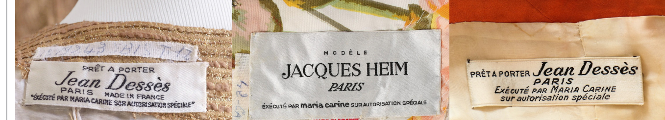
[ "Maria Carine" labels for "prêt-à-porter" clothing from the 1950s ]