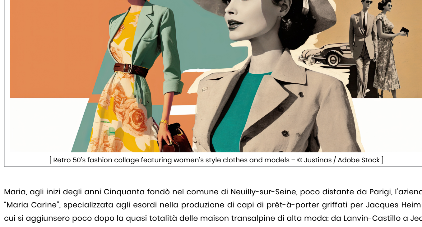
[ Retro 50's fashion collage featuring women's style clothes and models - ]