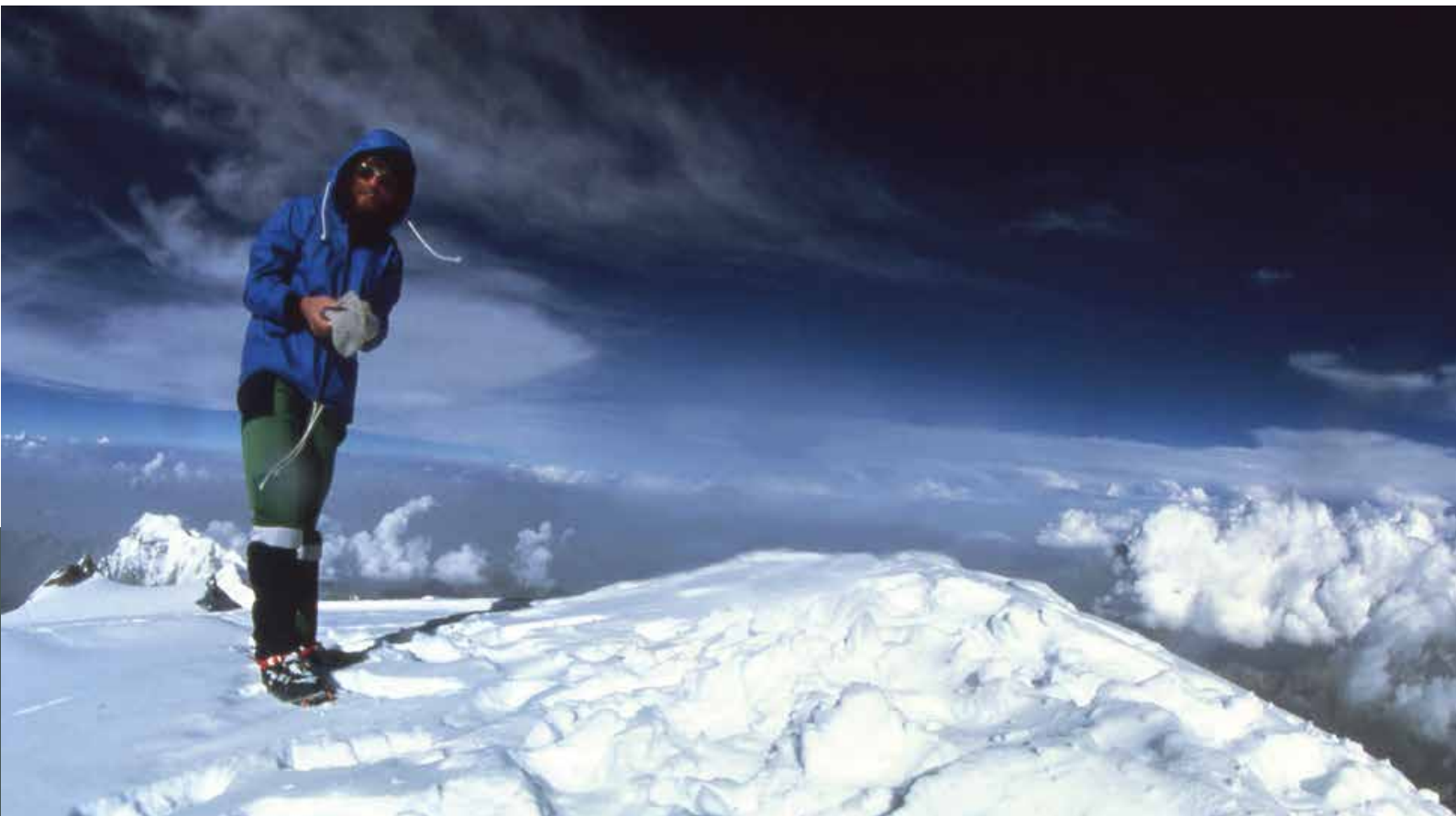
Een iconisch beeld: Reinhold Messner op de top van de Nanga Parbat (8126 meter). Hij was de eerste mens ter wereld die solo en zonder zuurstof een achtduizender beklom.

Messner verlegde zijn grenzen door ook de Noord- en de Zuidpool te overschrijden en enkele woestijnen te voet door te trekken. Zijn blijvende betekenis voor de bergsport ligt daarin dat hij op een kantelmoment het klimmen een meer ethische wending heeft gegeven. Hij was een bepleiter van 'by fair means' klimmen in tijden waarin het al te vaak 'by all means' dreigde te worden. Ook belangrijk is dat hij als eerste de alpiene stijl naar de Himalaya verplaatste.